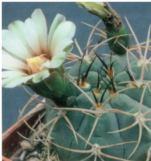
Figure 6 : Gymnocalycium ambatoense fleurit à seulement 5-6cm de diamètre, avec une forte spination déjà bien développée

reconnaissable aux minuscules morceaux de coquillages qu'il contient, est à proscrire complètement. Même laissés dans le même pot et le même substrat pendant quelques années, ils poursuivent leur croissance lentement mais sûrement, grandissent et finissent souvent par déformer le pot grâce à leurs racines. Mais ceci n'est pas recommandé pour avoir les meilleurs résultats, en particulier si vous avez l'intention d'exposer vos gymnos 1) : une plante ayant connu une croissance saine se démarquant nettement d'une autre ayant été maltraitée.